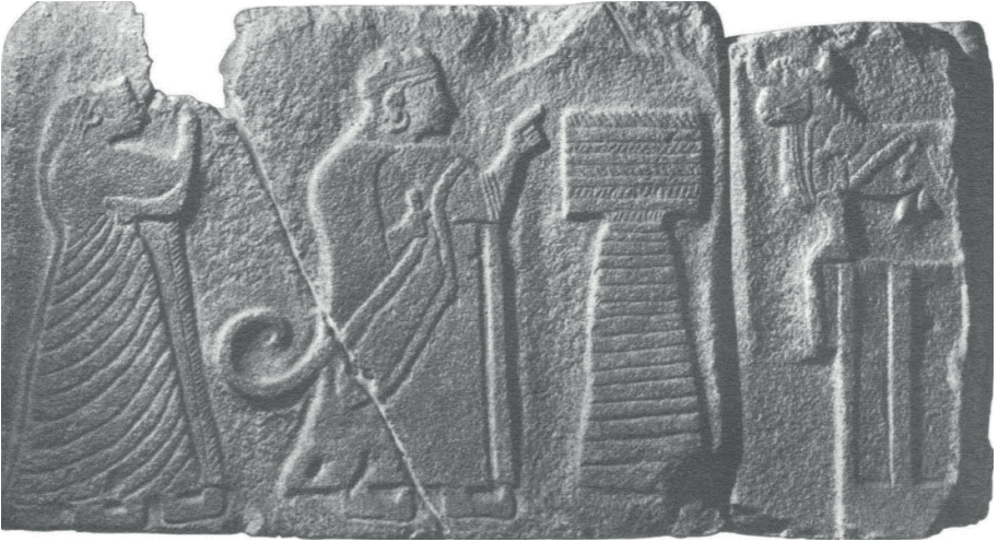
Alacahöyük kabartmaları kral betimlemesi (Ünal, 2003, 100)