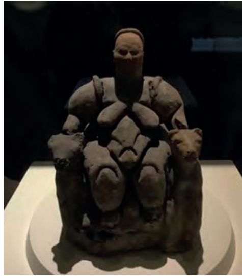
Resim 1. Kadın figürini, Çatalhöyük, MÖ 5750

Mellaart'tan sonra Walter Burkert ve Marija Gimbutas gibi isimler tarafından da savunulan hipoteze göre günümüzde "Venüs" olarak isimlendirilen bu heykelcikler, Yunan ve Roma'daki Ana Tanrıça'nın kökeninin MÖ 6000'e dayandığını ve onun Anadolu kökenli olduğunu göstermektedir. Fakat betimler dinsel amaçlarla kullanılmış olsalar bile bir Ana Tanrıça kültürüne ait olduklarına dair bugün