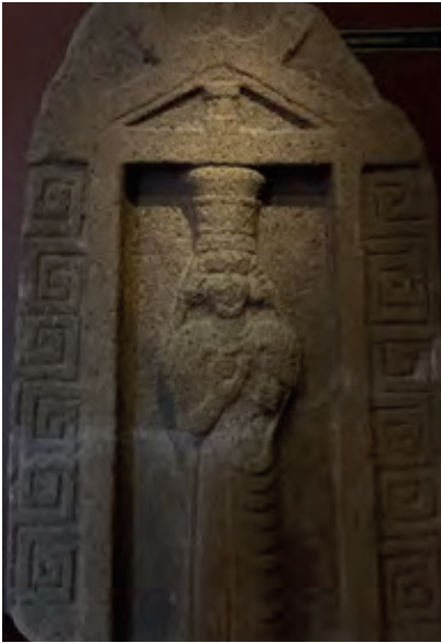
Resim 2. Kybele Kabartması, Ankara-Bahçelievler, MÖ 7. Yüzyıl

Boğazköy yakınındaki Salmanköy'de bulunan insan boyutundaki kadın heykeli 38 ve Batı Frigya'da yer alan, Tanrıça'nın aslanlarla betimlendiği Aslankaya kabartması da önemli yapıtlar arasında sayılabilir. Ana Tanrıça ve kültüyle ilgili olarak pek çok bölgede daha az vurgulu betimler olduğu gibi bu kabartma ve heykellerin yanı sıra Matar figürünün içerisinde yer almadığı yalnızca mimariden ibaret olan Batı Frigya'daki Midas Anıtı gibi kaya anıtı örnekleri de vardır. 39 Tüm bu buluntular çerçevesinde yapılan tespitler kültün özellikleri hakkında önemli bilgilere ulaşmamızı sağlasa da günümüzde hala devam etmekte olan arkeolojik kazı ve araştırmalar, bize Anadolulu Ana Tanrıça'nın özelliklerine dair yeni ipuçları vermeye devam etmektedir.