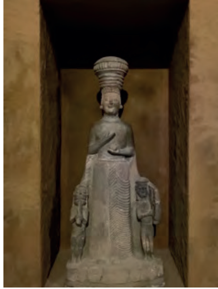
Resim 3. Kybele Kabartması, Boğazköy, MÖ 6. Yüzyıl