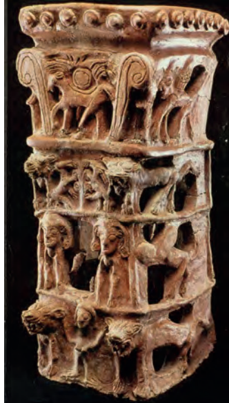
Ti'anik'te bulunan içi boş sütun