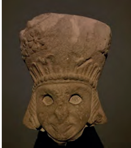
Resim 4. Kybele Başı, Salmanköy, MÖ 6. Yüzyıl

Frigyalılar'ın Anadolu'ya göç ederken Ana Tanrıça kültürünü yanlarında getirmedikleri, aksine Tanrıça'yı geldikleri topraklarda bularak kendi inançlarına kattıkları görüşü 40 , Anadolu'nun çeşitli bölgelerinden elde edilen bazı epigrafik ve arkeolojik verilere dayanmaktadır. Bu veriler bize, Anadolu'nun eski kültürlerinin Frigya'daki Ana Tanrıça kültürüne farklı açılardan etki ettiğini göstermektedir. Bununla birlikte, bugün bilinen kaynaklara göre Tunç ve Erken Demir çağlarında Anadolu'da "Ana" diye seslenilen tek bir tanrıça bulunmamaktadır. 41 Dolayısıyla-