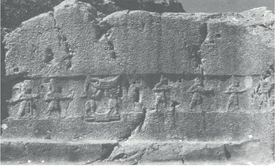
Yazılıkaya Açık Hava Tapınağındaki Hitit tanrıları (Ünal, 2003, 78)