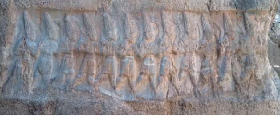
Yazılıkaya Açık Hava Tapınağı (Özdemir, 2020, 86)